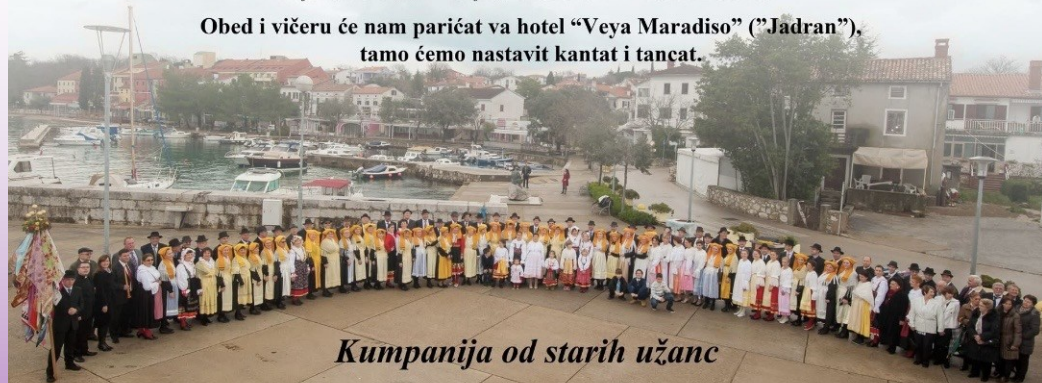
Kumpanija od starih užanc

Obed i vičeru će nam parićat va hotel "Veya Maradiso" ("Jadran"), tamo ćemo nastavit kantat i tanćat.